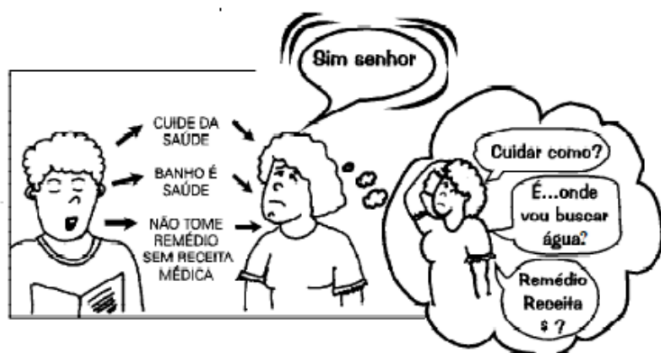
Figura 1: Diálogos sobre transmissão de informações sobre Saúde

No mesmo direcionamento, Pelicioni e Mialhe (2019) consideram que a educação em saúde não deve se restringir à perspectiva tradicional, ou seja, a de transmissão de informações ou à tentativa de mudança de comportamentos. Essa visão, por mais pragmática e importante que seja, promove uma “limitação” conceitual, restringindo e enfraquecendo a atuação. Sob outro ponto de vista, defende-se que a Educação em Saúde tem outras motivações, como: preparar indivíduos para o exercício da cidadania, favorecer a organização coletiva na luta por direitos, estimular o cumprimento de deveres e contribuir para a melhoria da qualidade de vida, possibilitando que os sujeitos se reconheçam como protagonistas de sua própria história. O diálogo da extensão universitária com o território torna-se fecundo e significativo na promoção dessas ações. A figura a seguir ilustra a concepção tradicional limitada da Educação em Saúde como ação de mera transmissão de informações sem um diálogo com os múltiplos contextos que permeiam a vida humana.